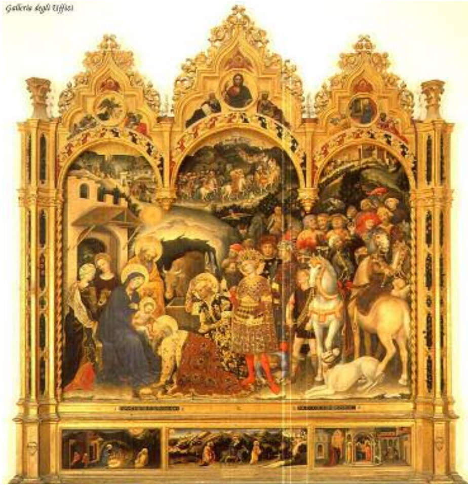
جینتلی دی فابریانو Gentile de fabriano